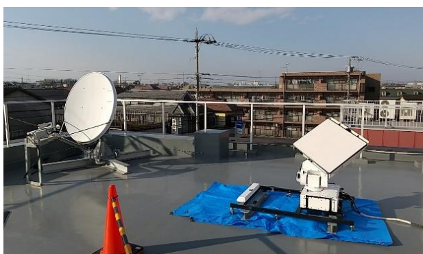
図 2 : Gateway 局、VSAT 局