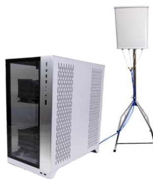
図 3 : gNB (5G 基地局)